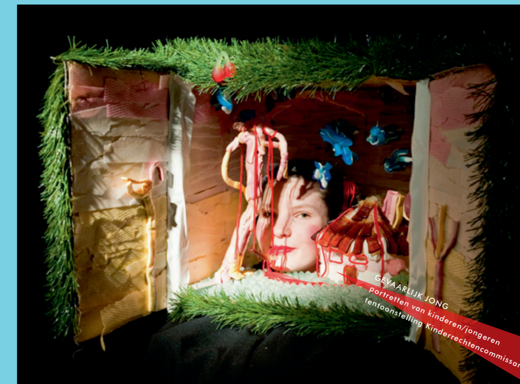
GEVAARLIJK JONG portretten van kinderen/jongeren tentoonstelling Kinderrechtencommissariaat