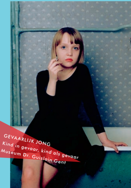
GEVAARLIJK JONG Kind in gevaar, kind als gevaar Museum Dr. Guislain Gent

Meer informatie omtrent de voorstellingen, de theaterspecial en de daaraan gekoppelde workshops, begeleidingsmappen en voorbesprekingen mag u binnenkort verwachten via www.kopergietery.be en www.gevaarlijkjong.be