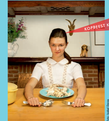
KOPBEEST Kopergietry Gent